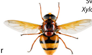
En bålgetinglik blomfluga, Volucella zonaria

Många flugor (Diptera, tvåvingar) kan likna getingar eller bålgetingar. De skiljer sig dock från dem genom att de bara har ett par vingar istället för två. Deras ögon är oftast mer klotformiga och antennerna är betydligt kortare.