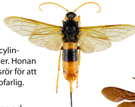
Stor hornstekel, Urocerus gigas

Stor hornstekel , Urocerus gigas , är en vedstekel vars larver äter trä. Denna svart- och gulrandiga stekel kan lätt skiljas från en bålgeting genom sin cylinderformiga kropp och sina långa, helt gula antenner. Honan kan bli 45 mm lång och har ett långt äggklämningsrör för att kunna lägga ägg i trädstammar. Denna art är helt ofarlig.