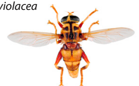
Blomfluga, Milesia crabroniformis