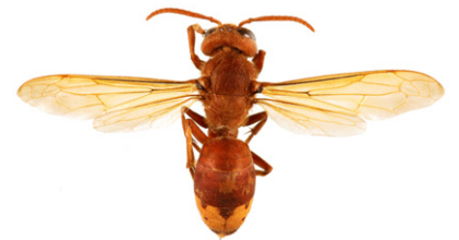
Asiatisk bålgeting, Vespa orientalis

Övriga getingar är mindre än bålgetingar. Arbetarna är ca 15 mm långa i slutet av sommaren. Observera dock att en drottning kan bli strax över 20 mm lång, vilket är ungefär lika långt som en sammetsgeting om man inte räknar med sammetsgetingens huvud. På våren kan därför getingar faktiskt vara större än de tidigast födda bålgetingsarbetarna.