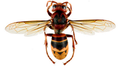
Europeisk bålgeting, Vespa crabro

Asiatisk bålgeting , Vespa orientalis , är lika stor som den europeiska bålgetingen. Den är helt brunröd, enbart dess huvud sett framifrån och ett brett band på bakkroppen är gula. Den finns bara i sydöstra Europa (södra Italien, Malta, Albanien, Grekland, Cypern, Rumänien och Bulgarien).