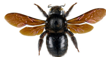
Svartsnickarbi, Xylocopa violacea

Svartsnickarbi , Xylocopa violacea , är 20-30 mm lång och helsvart med blåliga skiftningar. Honor av detta solitärbi, som liknar en svart humla, bygger bon i förmultnande trädstammar och samlar pollen som föda åt sina larver. Svartsnickarbi finns i södra Europa och har påträffats i Sverige tillfälligt.