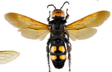
Mammutdolkstekel, Megascolia maculata

Svartsnickarbi , Xylocopa violacea , är 20-30 mm lång och helsvart med blåliga skiftningar. Honor av detta solitärbi, som liknar en svart humla, bygger bon i förmultnande trädstammar och samlar pollen som föda åt sina larver. Svartsnickarbi finns i södra Europa och har påträffats i Sverige tillfälligt.