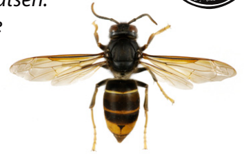
Sammetgeting/Asiatisk rovgeting, Vespa velutina

Europeisk bålgeting , Vespa crabro , har en övervägande gul bakkropp med svarta ränder. Huvudet är gult sett framifrån och brunrött sett uppifrån. Mellankroppen och benen är svarta och rödbruna. Arbetarna är mellan 18 och 23 mm långa och drottningarna mellan 25 och 35 mm långa.